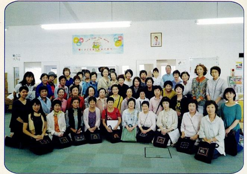
Members of International Angel Association in Japan