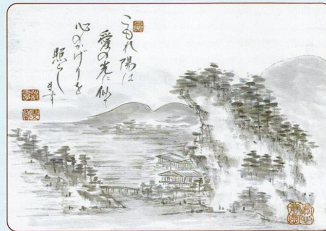
Sketch : Yuriko Kawamura

12. Sreejoni : Non formal primary education support is given to 60 children each year of Konabari area. Educational materials & everyday tiffin is provided to them.