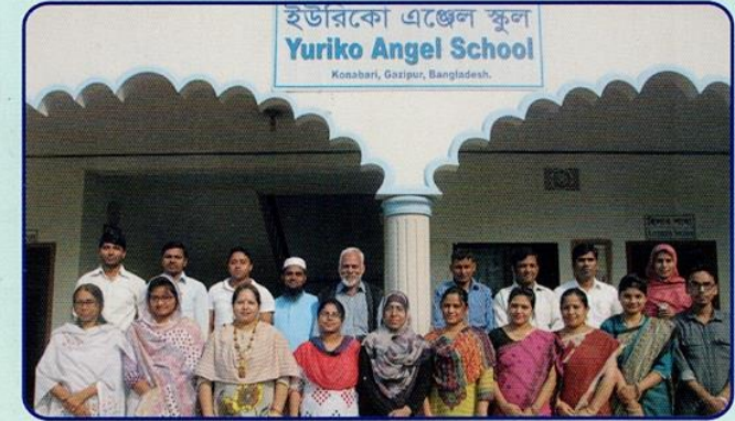
Staffs of International Angel Association, Bangladesh